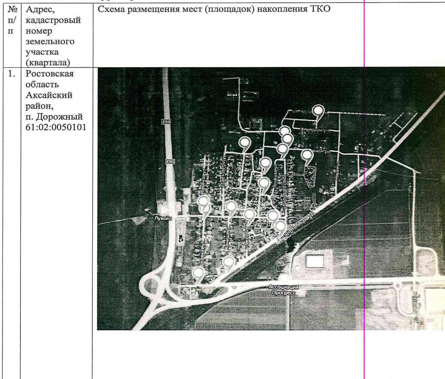
Схема размещения мест (площадок) накопления твердых коммунальных отходов на территории Истоминского сельского поселения